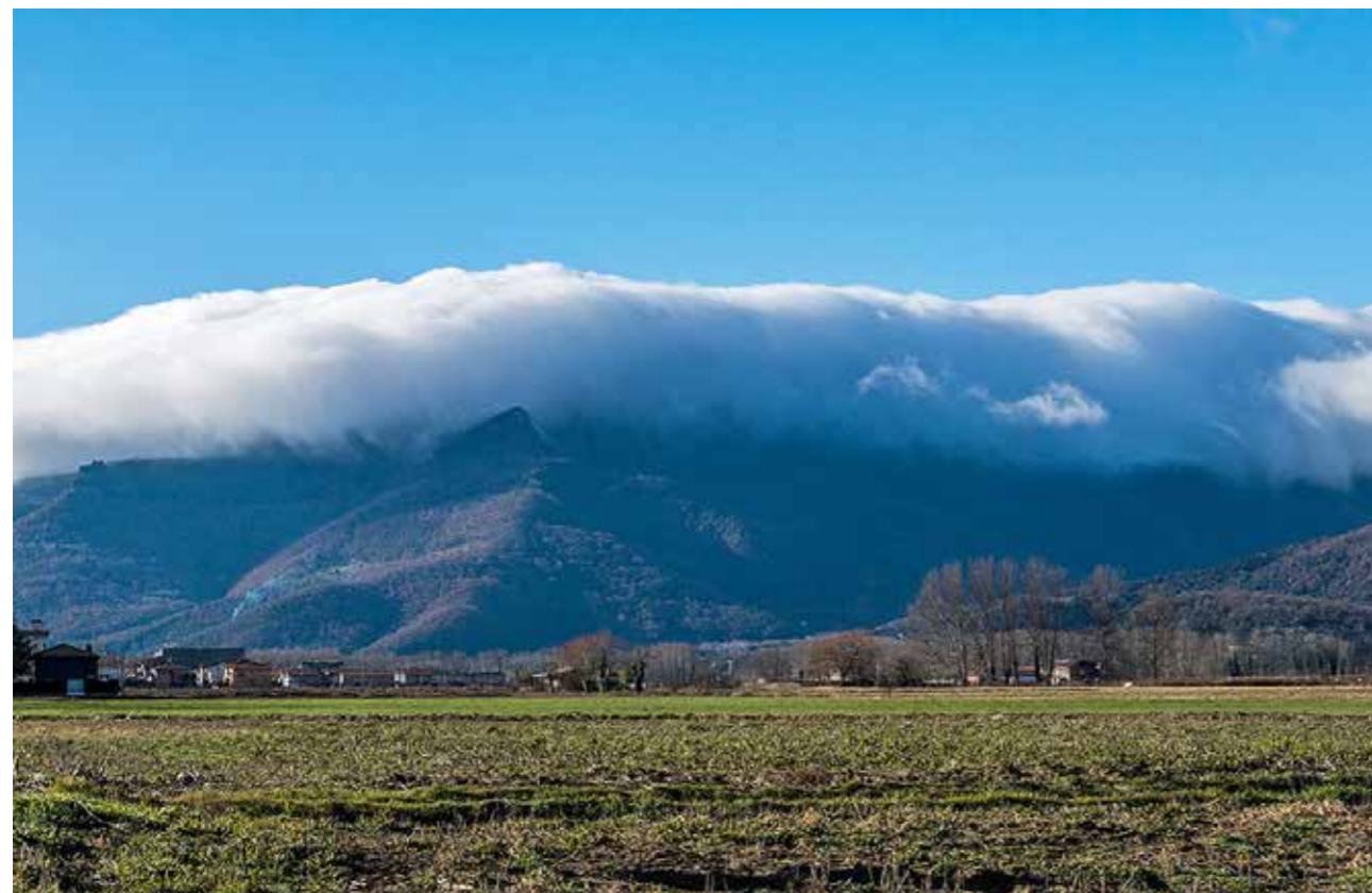
Núvols baixos tapen completament el sector del Puigsacalm.

La boira, és a dir, els núvols enganxats al relleu, pot formar-se durant tot l'any a l'alta, la mitjana i la baixa muntanya i en situacions meteorològiques molt diverses. La principal afectació són els problemes d'orientació que pot implicar trobar-nos dins del núvol. Ens pot portar a no reconèixer el nostre entorn més enllà de pocs metres, a perdre les referències (nord, sud, est, oest) i a deixar de veure corriols poc marcats, senyals o passos per superar, per exemple, una grimpada o ascensió.