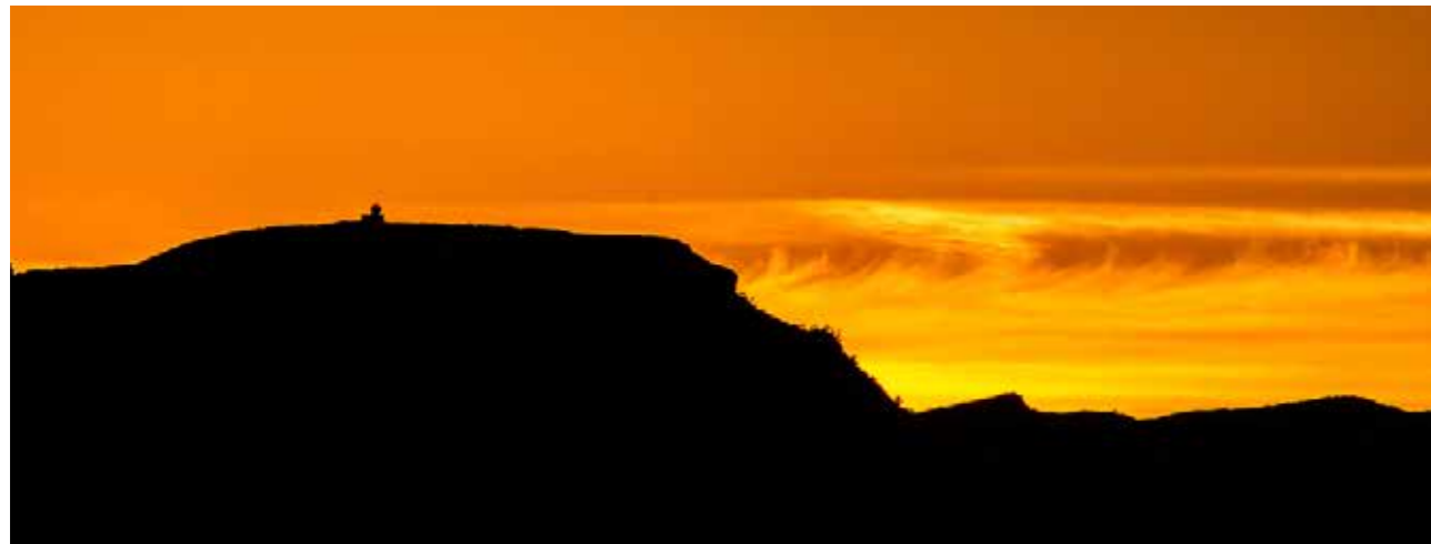
El radar de Tivissa-Llaberia s'ubica a dalt de la Miranda (919 m), a la serra de Llaberia.

Quan som a la muntanya, la precipitació ens pot afectar per canvis importants en l'estat dels camins, dificultat dels barrancs o desconfort tèrmic, entre altres efectes. Quan va associada a tempesta, caldrà estar molt atents també als llamps i, fins i tot, a fenòmens de temps sever com el vent fort o la pedra. A més a més, no hem d'oblidar la precipitació en forma de neu, ben present a les nostres muntanyes durant la meitat freda de l'any.